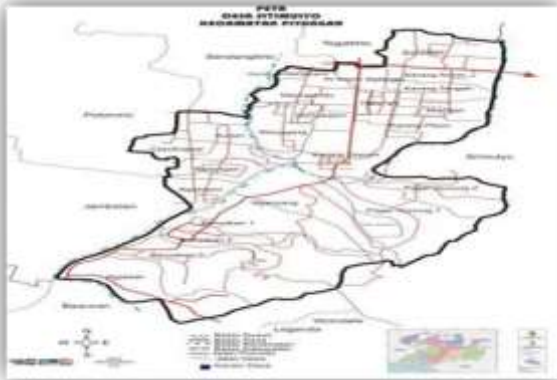
Gambar 1: Peta lokasi Desa Seloprojo, Kecamatan Samaseneng