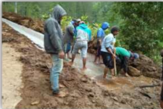
Gambar 4: Suasana pembuatan saluran irigasi oleh Mahasiswa dan Penduduk Desa Sinisuka pada tanggal 21 April 2021