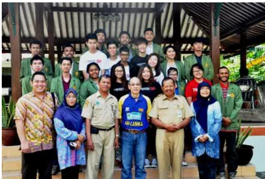
KKN Internasional antara Mahasiswa Singapore Polytechnic (SP) dan UPN VY Yogyakarta, 12 Maret 2015