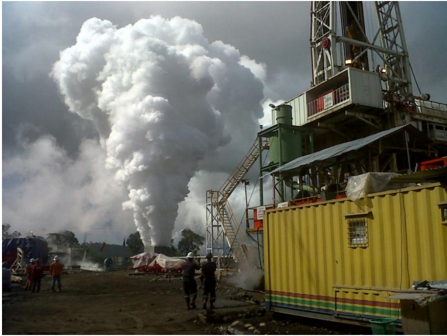
Kerja Sama dengan LPPM UPNVY Geothermal Kamojang