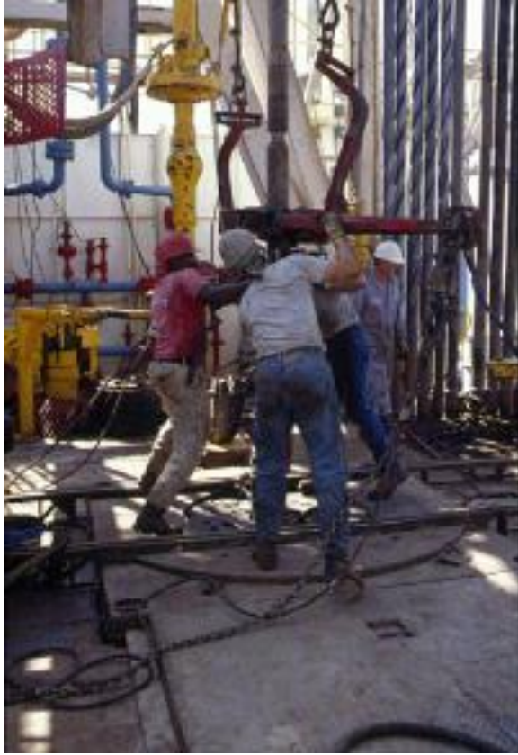
Kerja Sama dengan LPPM UPNVY Drilling the Wall