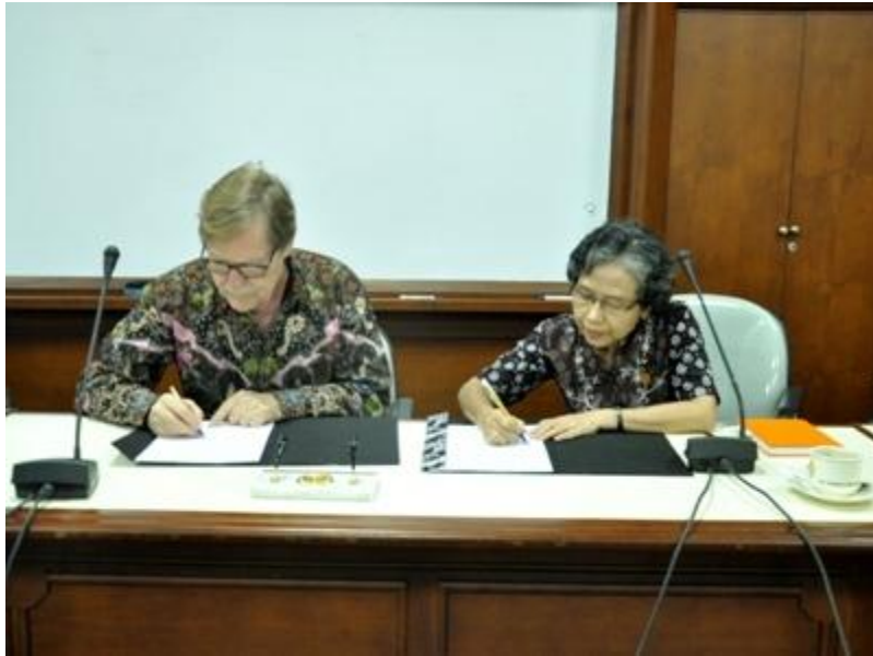
UPN "Veteran" Yogyakarta Jalin kerjasama dengan Capa House Yogyakarta, 9 Maret 2015