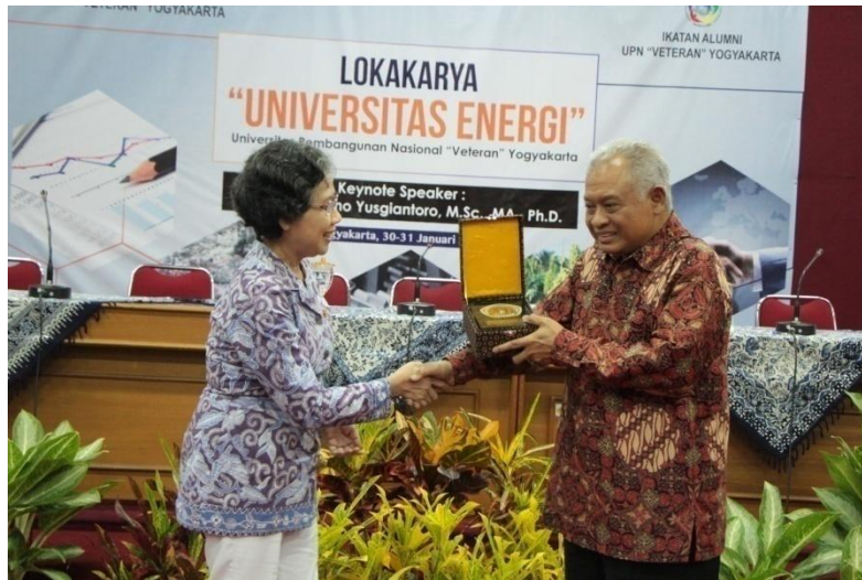
LOKAKARYA "Universitas Energi" Universitas Pembangunan Nasional "Veteran" Yogyakarta Yogyakarta, 30-31 Januari 2015