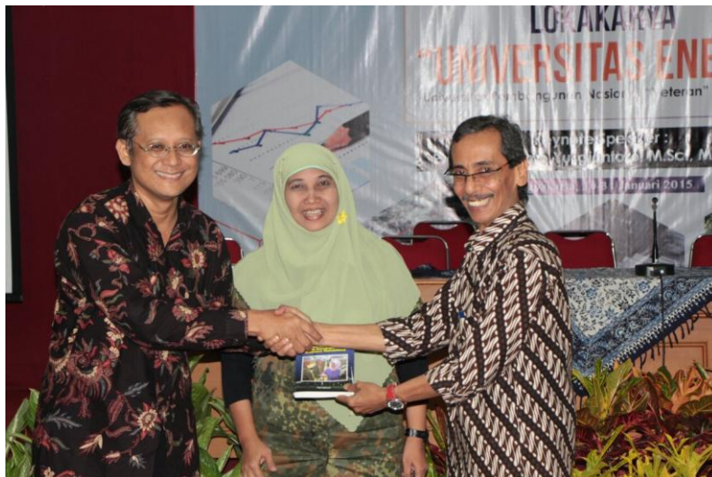
LOKAKARYA "Universitas Energi" Universitas Pembangunan Nasional "Veteran" Yogyakarta Yogyakarta, 30-31 Januari 2015