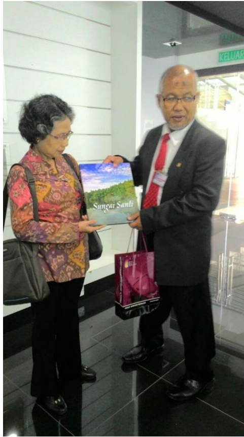
Kerja Sama dengan Universitas Kebangsaan Malaysia Malaysia, 23 Maret 2015