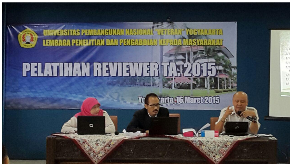
Pelatihan Reviewer Tahun Ajaran 2015 Yogyakarta, 16 Maret 2015