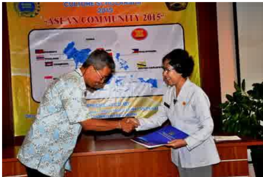
Indonesia Art and Culture Scholarsip 2015, Kementerian Luar Negeri, dan UPNVY