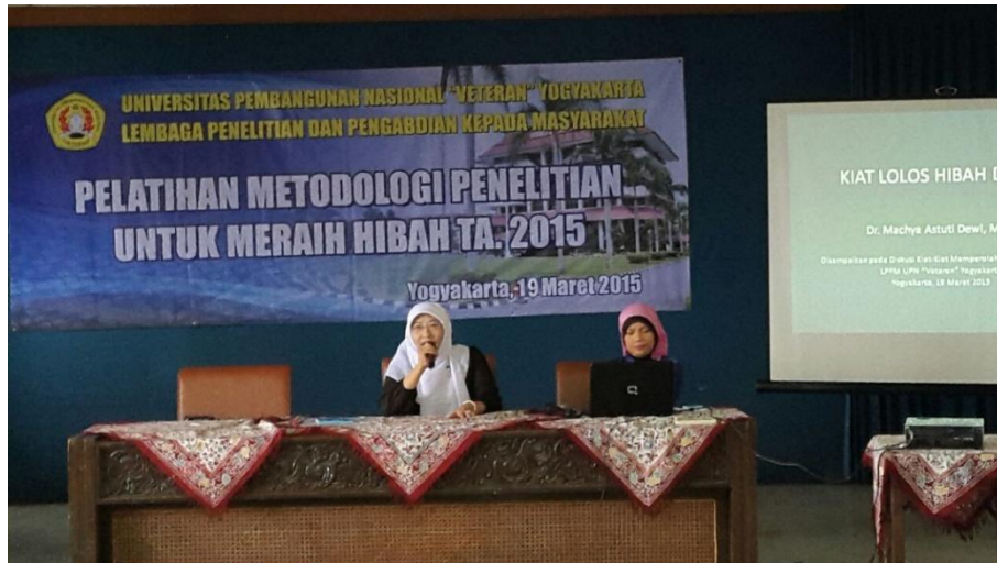
Pelatihan Metodologi Penelitian Untuk Meraih Hibah Tahun Ajaran 2015 Yogyakarta, 19 Maret 2015